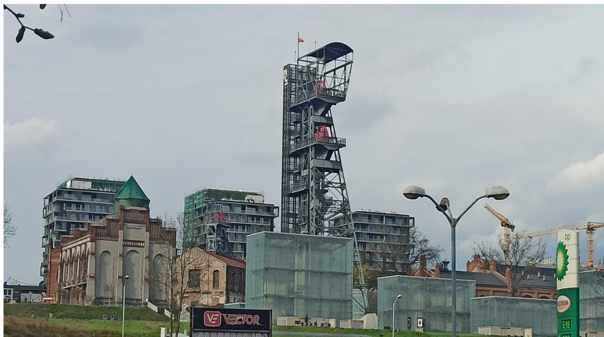
Muzeum Śląskie (dawna Kopalnia Katowice) z dominantą - szybem Warszawa. Zrewitalizowana zabudowa górnicza - obecna atrakcja miasta.