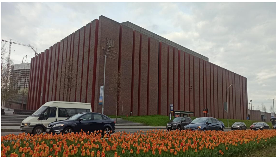
Monumentalny budynek Narodowej Orkiestry Symfonicznej